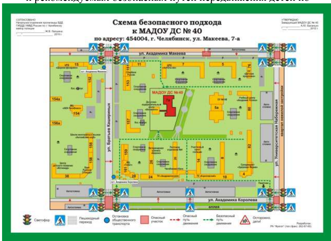
Схема движения транспортных средств к местам разгрузки/погрузки и рекомендуемых безопасных путей передвижения детей по

Район расположения ОУ, пути движения транспортных средств и детей (воспитанников)